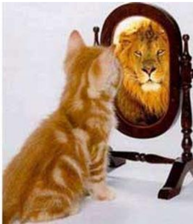
1 Sm 17:33-36