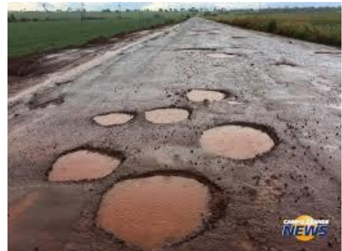
O Amor Natural