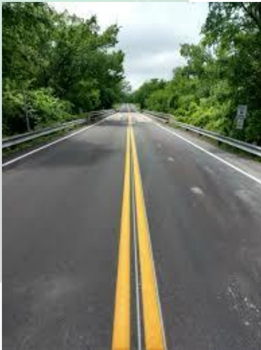
O Caminho mais Excelente O Amor Ágape